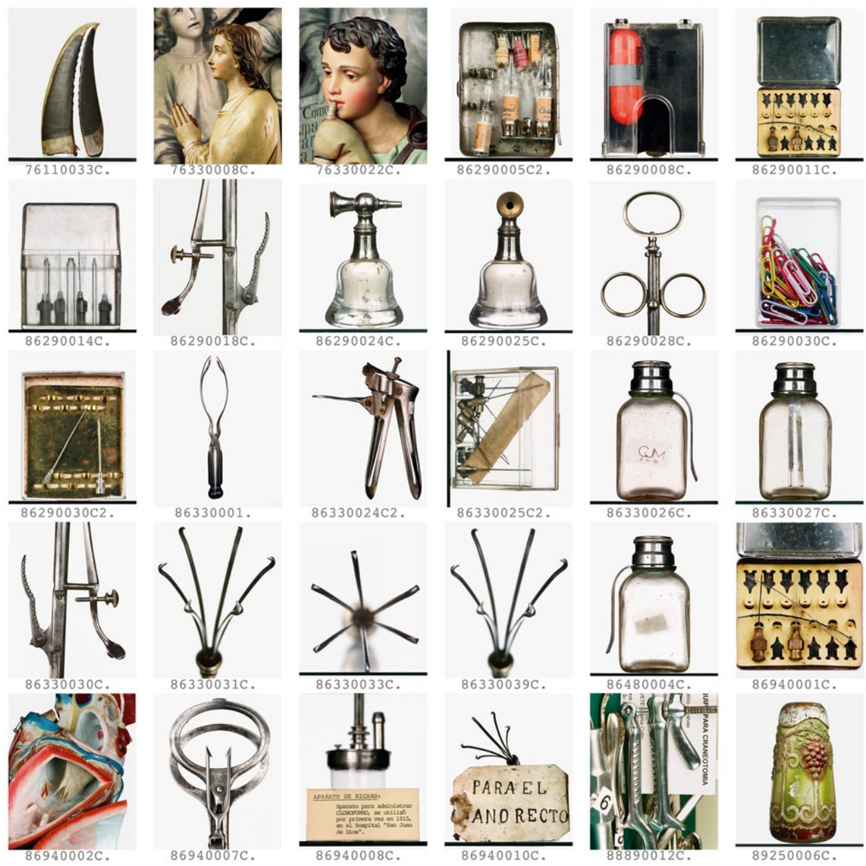
apothecaries, archives, icons, ... Fred Langford Edwards