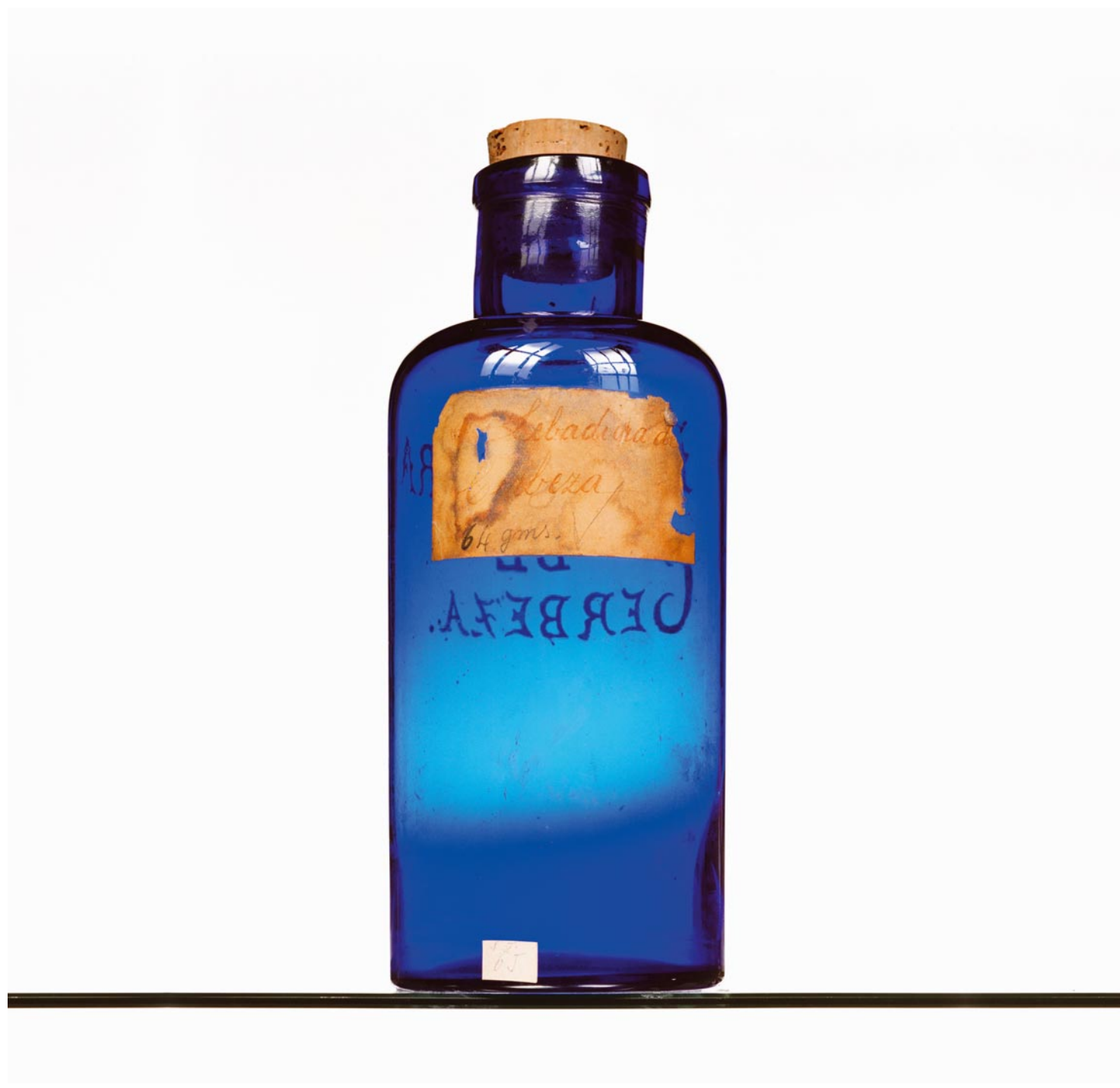
apothecaries, archives, icons, ... Fred Langford Edwards